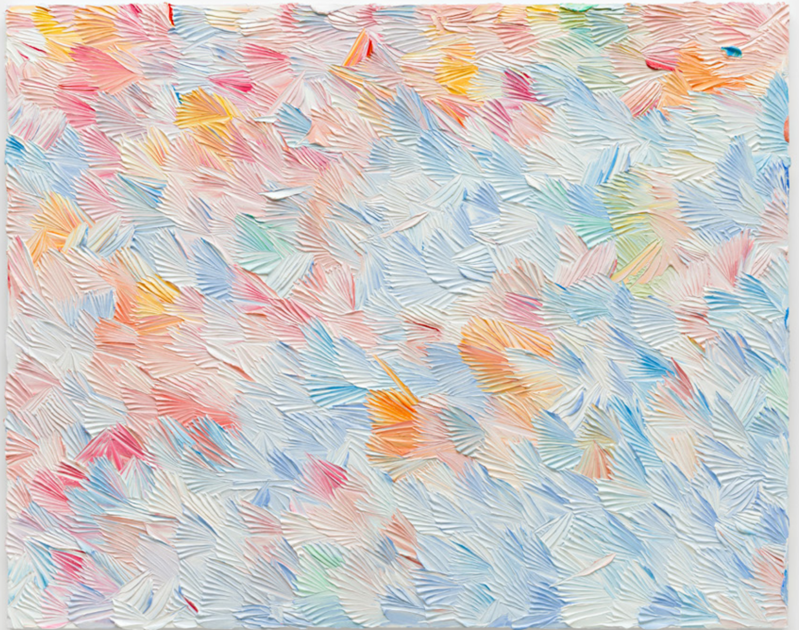
A Climb of Sorts, 2023 óleo sobre tela oil on canvas 122 x 152 cm 48 x 60 in